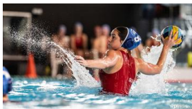
INSEP vs. Suisse

Die Versammlung schloss mit den Informationen zu der nachfolgenden Delegiertenversammlung, zu der Stellenausschreibung eines neuen Liga-Verantwortlichen NLA sowie zum Club Management Lehrgang.