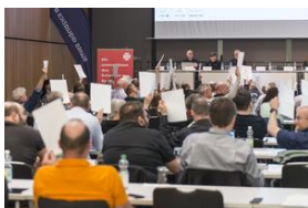
Delegierte bei Abstimmabgabe