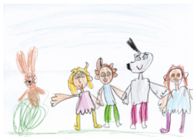
Dessin d'Alina, Doamt/Ems

Le 22 septembre 2023 à Ittigen et le 18 novembre 2023 à Uster, nous organiserons les prochaines journées de présence du cours "Club Management". Le cours "Club Management" est une formation continue complète qui encourage et développe les compétences de direction et le savoir spécialisé des futurs membres et des membres actuels des comités de clubs. Grâce à l'E-Learning individuel, le savoir est transmis en grande partie indépendamment du temps et du lieu. Lors de nos journées de présence, nous transmettons des thèmes spécifiques à la fédération et à la discipline sportive et répondons aux préoccupations et aux besoins des clubs. Nous accordons également une grande importance à l'échange et au développement de réseaux entre les clubs et la fédération. Inscrivez-vous dès aujourd'hui et passez à l'étape suivante : "Club Manager". Tu seras ainsi prêt·e à aborder la journée de présence inspiré·e et motivé·e. Plus d'informations sur academy.swissolympic.ch .