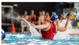
INSEP vs. Suisse

L'assemblée s'est terminée par des informations sur l'assemblée des délégués qui allait suivre, sur la mise au concours d'un nouveau responsable de la ligue LNA et sur le cours de management de club.