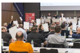
Délégué·e·s lors du vote