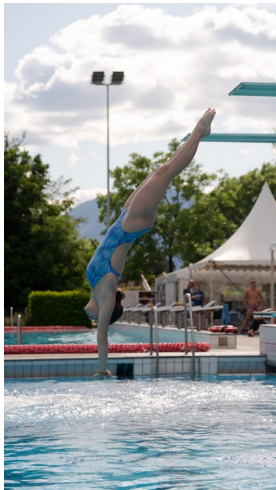
3T in Tenero

Den kompletten Bericht finden Sie hier .