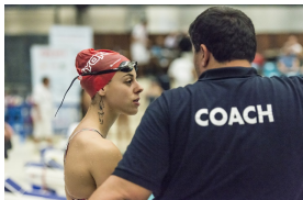
Athletin und ihr Trainer

Worauf wartest du also? Melde dich jetzt über deinen J+S Coach an, um dir einen Platz im Kurs " Schwimmtechnik mit Fokus Rücken / Brust " vom 24. September 2023 zu sichern! Der Anmeldeschluss ist der 24. Juli 2023.