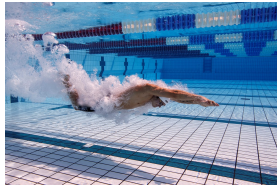
Race Suit Testing in Tenero