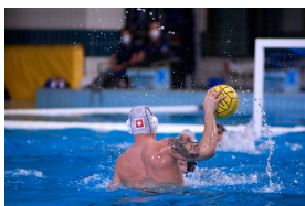
Frankreich vs. Schweiz, EM-Qualifikation 2022,