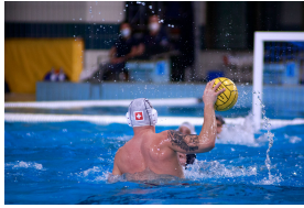
France vs. Suisse, tournoi de qualification pour le CE 2022, Kranj (SLO)