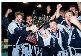
SC Kreuzlingen, vainqueur de la Coupe de Suisse 2023