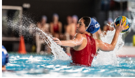
Suisse vs. Mulhouse, Championnat de France 2023, Mulhouse (FRA)

Buts SC Horgen : Redder Benjamin (1), Kieloch Oskar (1), Szer Domonkos (1), Herzog Philipp (1), Manojlovic Marko (1), Enloe Greg (1)