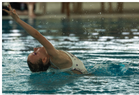
Championnats Suisses de la relève à Le Lignon