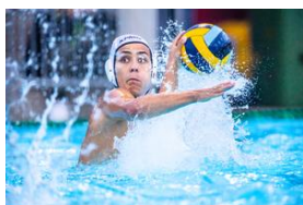
SC Kreuzlingen, Champion Suisse 2023