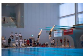
Lara El Batt & Louna Iacazzi, 8 Nations Diving Cup, Lausanne