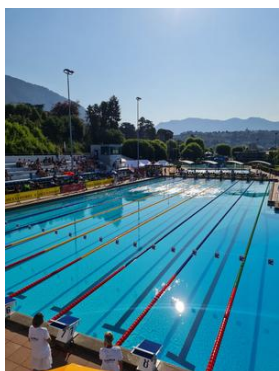
CSE Chiasso 2023