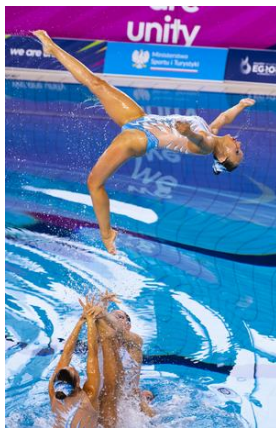
Team Free Finals, European Games 2023, Krakow-Malopolska