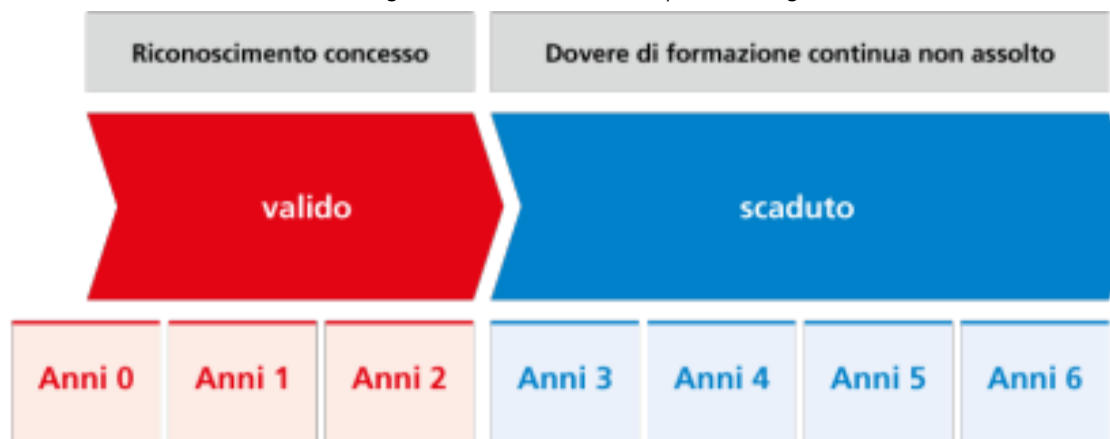
Figura 4: Stato del riconoscimento (copie di G+S)

La validità di un riconoscimento è regolata da G+S e Swiss Aquatics è regolata allo stesso modo.