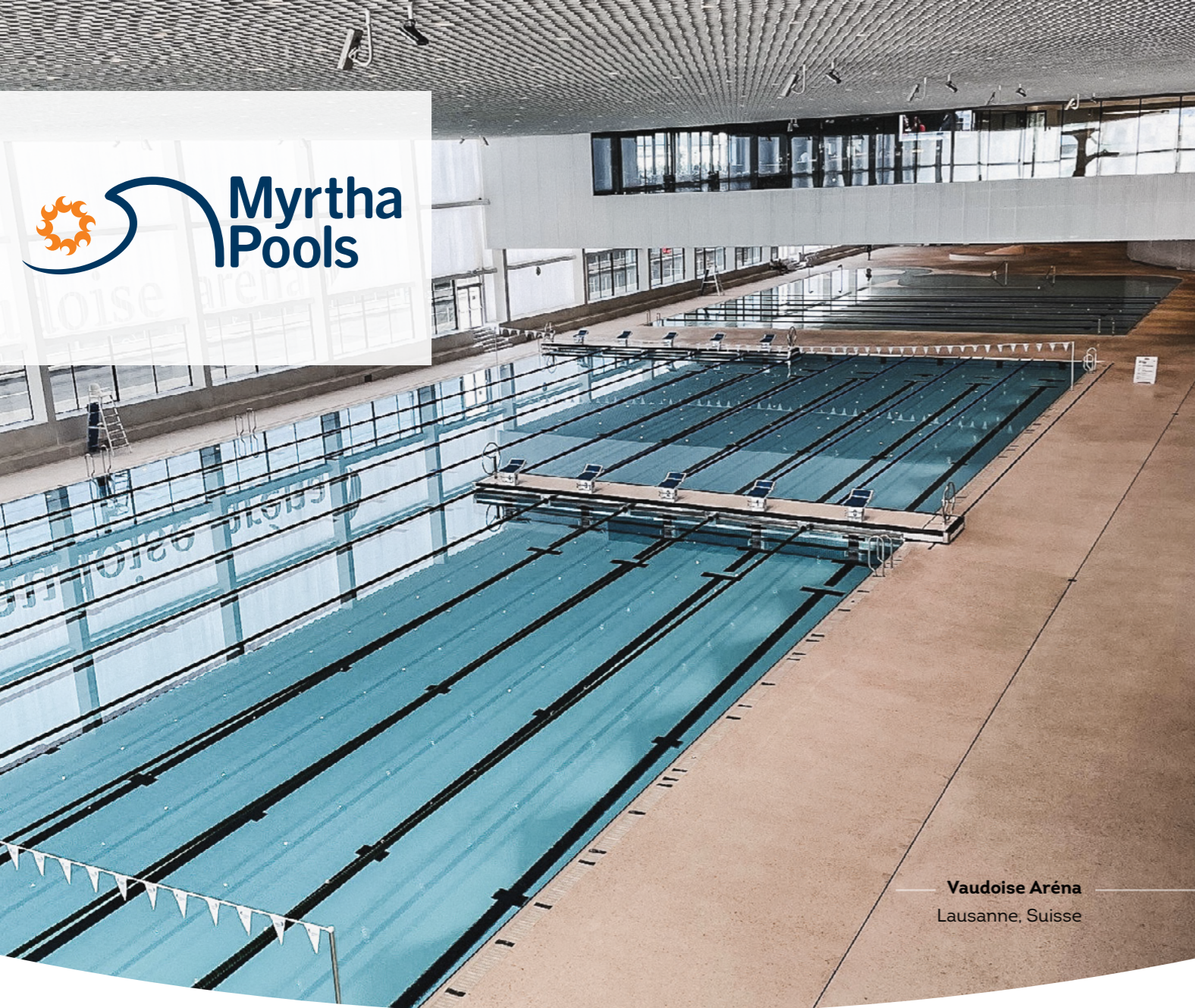
Vaudoise Aréna Lausanne, Suisse