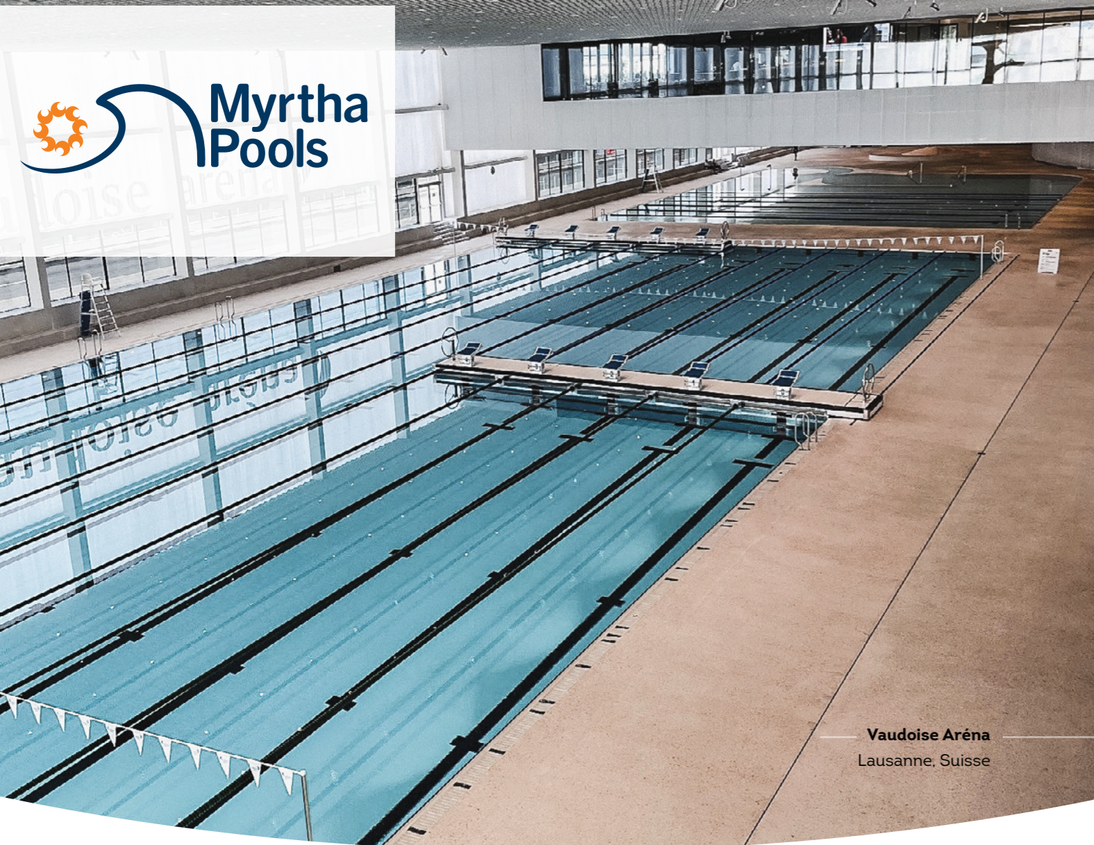
Vaudoise Aréna Lausanne, Suisse