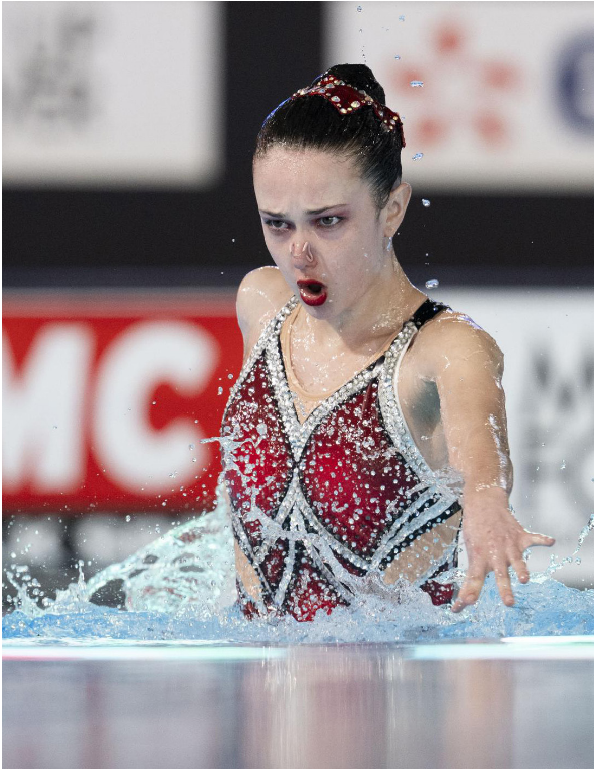
Artistic Swimming World Cup 2024, Paris