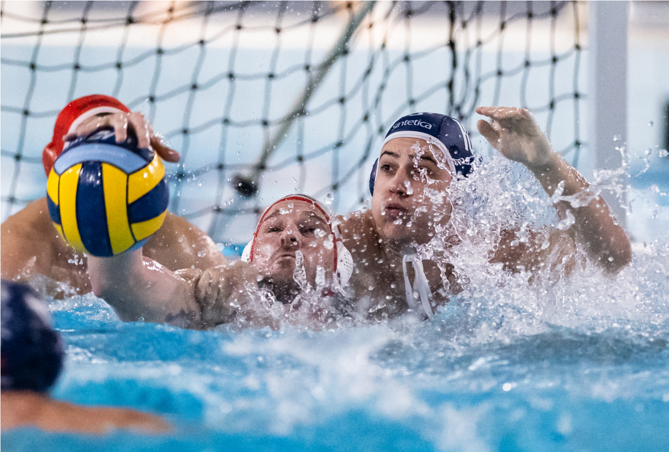
Tournoi d'ouverture de la LNA à Montreux

« La promotion d'une culture fondée sur le respect, l'intégrité et l'équité reste au cœur de notre action. »