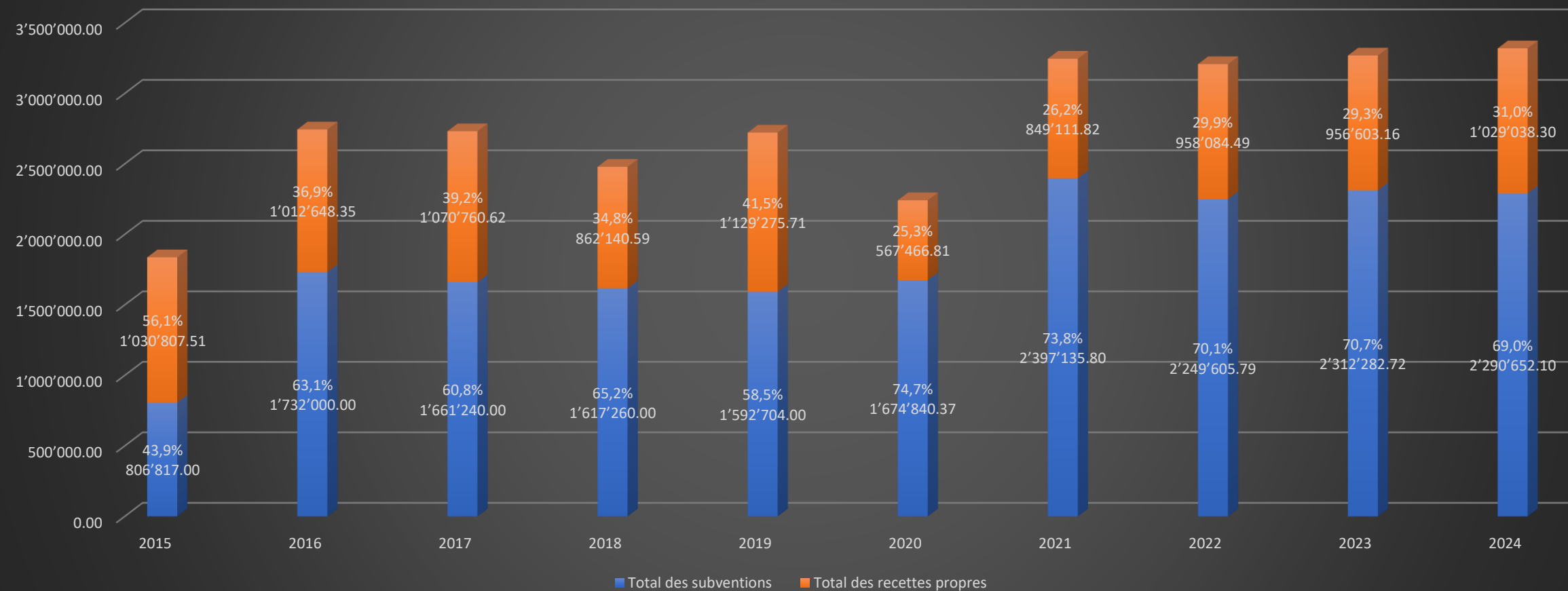
Total des recettes SWI - relations fonds propres vs subventions